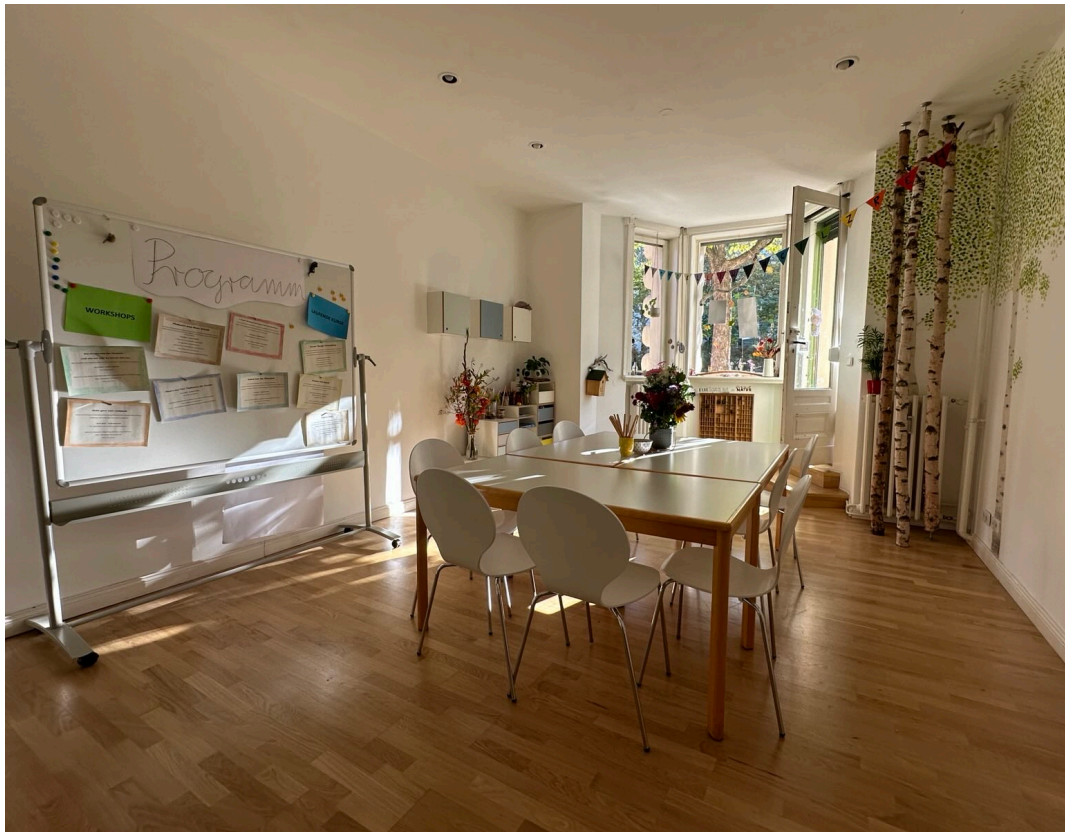
Seminarraum mit Zugang zur Straße: